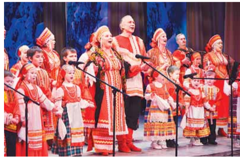
На сцене – артисты фольклорной студии «Вечора»