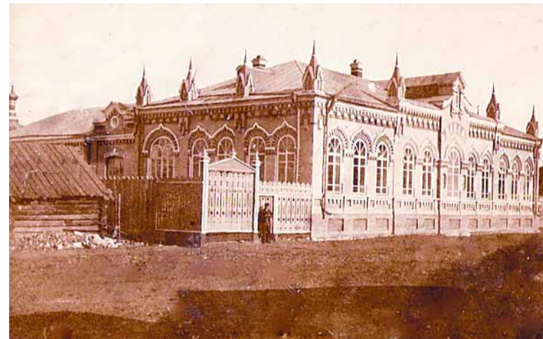
Церковно-приходская школа, бывшая при храме в Левшино