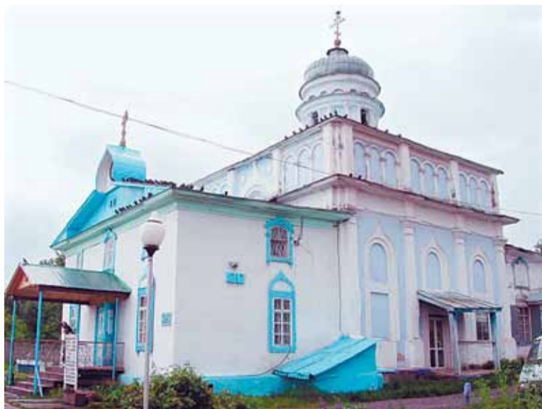
Храм святого апостола и евангелиста Иоанна Богослова

Увы, годом окончания Пермской духовной семинарии для