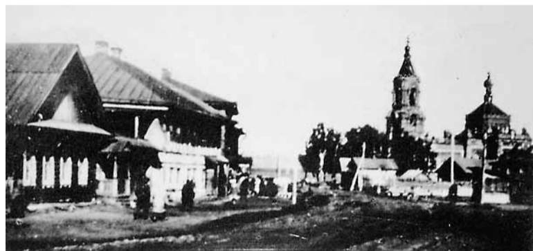
Дереволюционное Левшино. На заднем плане – храм

Один из архивных документов свидетельствует о том, насколько крепки были духовные традиции в селе: «Отношение прихожан к церкви, за малым исключением, благоприятное и любовное. Долг святых таинств исповеди и причащения исполняют целыми семьями, особенно в воскресные и праздничные дни. Храм посещают усердно».