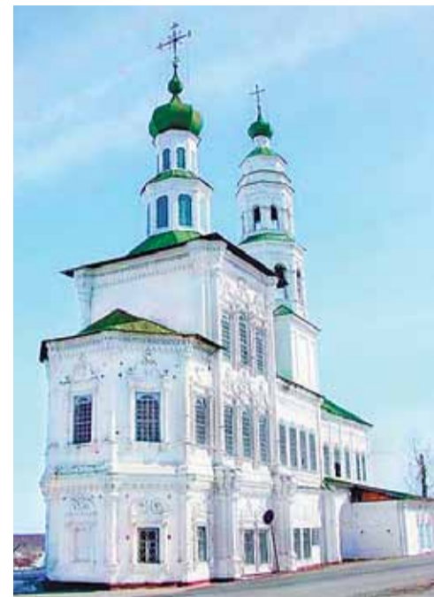
Соликамск. Храм святого пророка Иоанна Предтечи