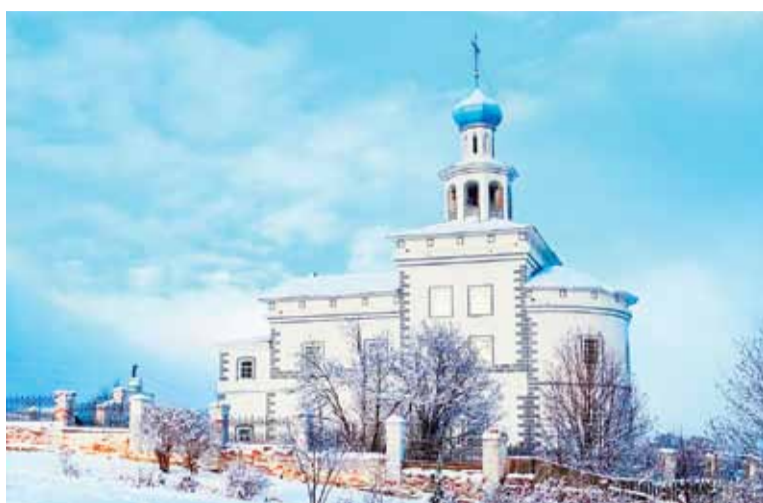
Чердынь. Храм святого апостола Иоанна Богослова

Пасха красная! Праздников Праздник! Колокольный звон в пасхальной ночи, от Никольского храма Ныроба, дальнего северо-востока Соликамской епархии, – до чудовских церквей на юге. Слышен перезвон чердынских храмов – Воскре-