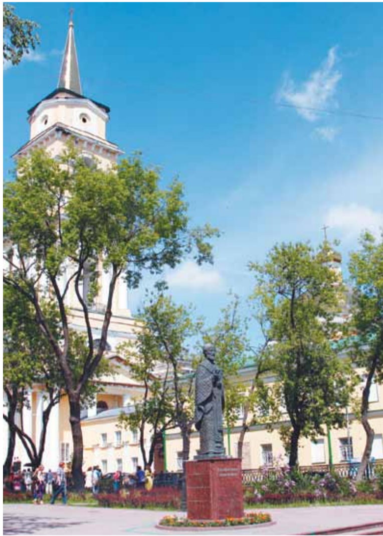
Современный вид Спасо-Преображенского кафедрального собора