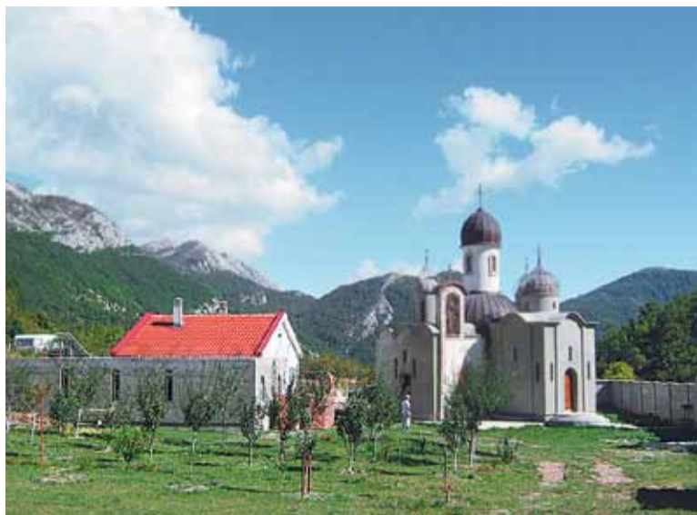
Монастырь прп. Сергия Радонежского

Во времена нашествия турок случилось несчастье: магметане осквернили и разрушили Троицкую церковь. В тех пор в народе появилось предание, что за грехи христиан Господь забрал церковь на небо и не вернет ее, пока люди не одумаются и не научатся жить так, как заповедал им Он. С этих пор каждый паломник, совершающий восхождение к вершине Румии, берет