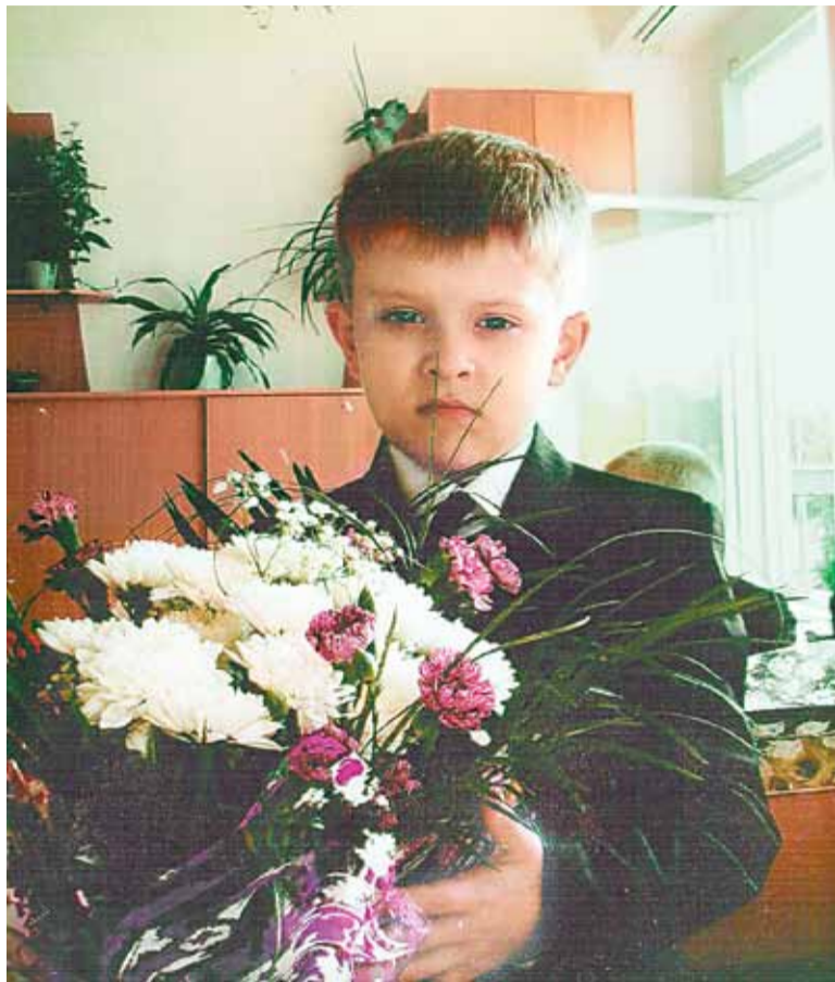
Цветы для любимой учительницы