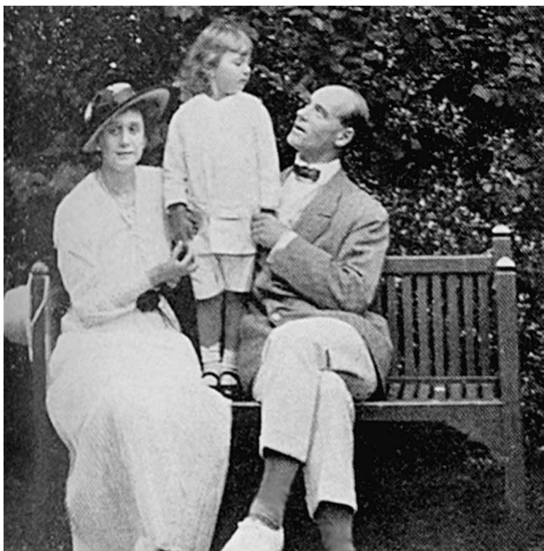
Михаил Александрович с супругой Натальей и сыном Георгием

3 марта 1917 г. думцы начали искать поводы для отступления от своих прежних намерений о поддержке Михаила Александровича. Вспомнили его морганатический брак с женщиной, «известной своими политическими интригами», и то, что он никогда не интересовался государственными делами. Милюков и Керенский, сохранявшие самообладание, понимали, что теперь принципиальный вопрос заключается в том, будет или не будет монархия вообще. Керенский понял, что дело идет к республике: «Все утешились мыслью, что с разрывом прямой линии престолонаследия зависший вопрос о династии разрешен». Депутаты Государственной Думы принимают решение встретиться с Михаилом Александровичем.