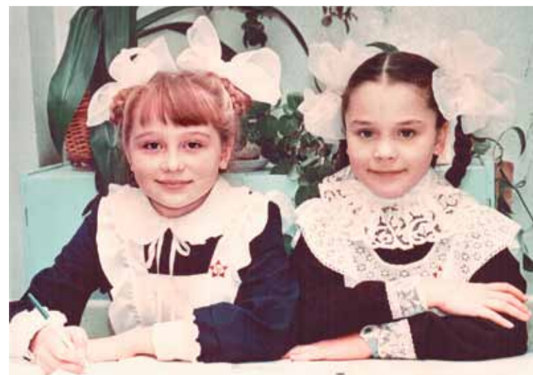
Мы – отличницы!