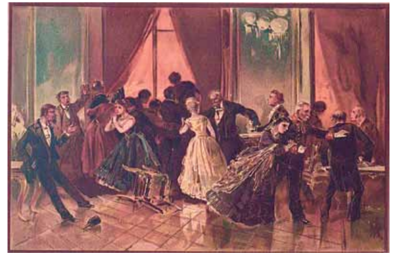
Иллюстрация Н.М. Карамзина к роману «Бесы»

Уже первые страницы романа должны были насторожить внимательного читателя, увидевшего в лице этого персонажа облик антихриста. Достоевский указывает на ряд характерных черт. Ставрогин обладает некой мистической способностью подчинять себе людей, в силу которой одни его любили, другие – ненавидели, но все признавали его особую,