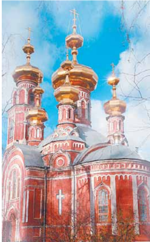
Так выглядит церковь в наши дни

архиепископом Пермским и Верхотурским. К концу 1879 г. было закончено строительство храма и начаты работы по его внутренней отделке. 8 июля 1882 г. в Осе произошло знаменательное событие: был освящен новый храм Казанской