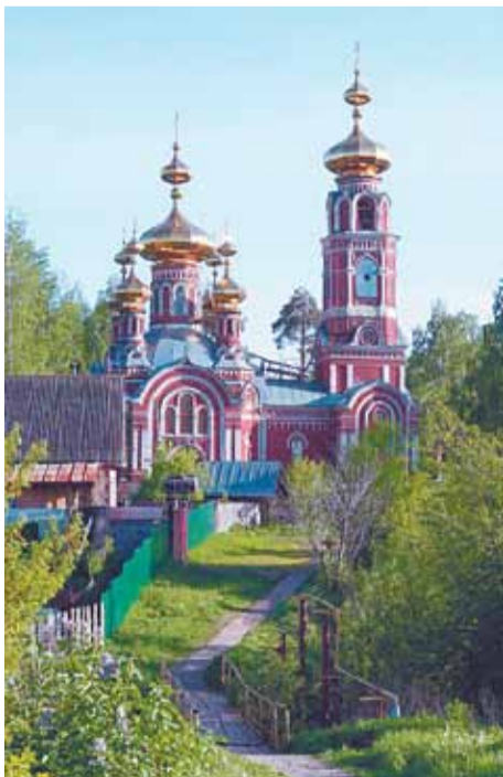
Дорога к храму

5 октября 1876 г. план и грамота на заложение храма были подписаны Его Высокопреосвященством Антонием,