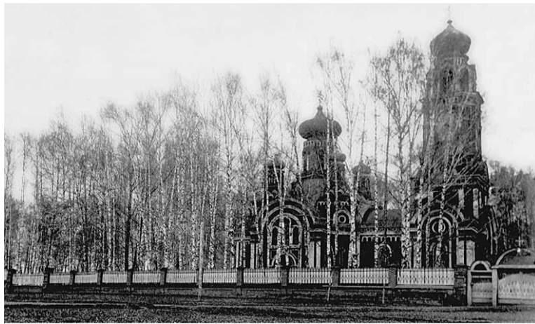
Богородице-Казанский храм в 60-е годы XX в.

архиепископом Пермским и Верхотурским. К концу 1879 г. было закончено строительство храма и начаты работы по его внутренней отделке. 8 июля 1882 г. в Осе произошло знаменательное событие: был освящен новый храм Казанской