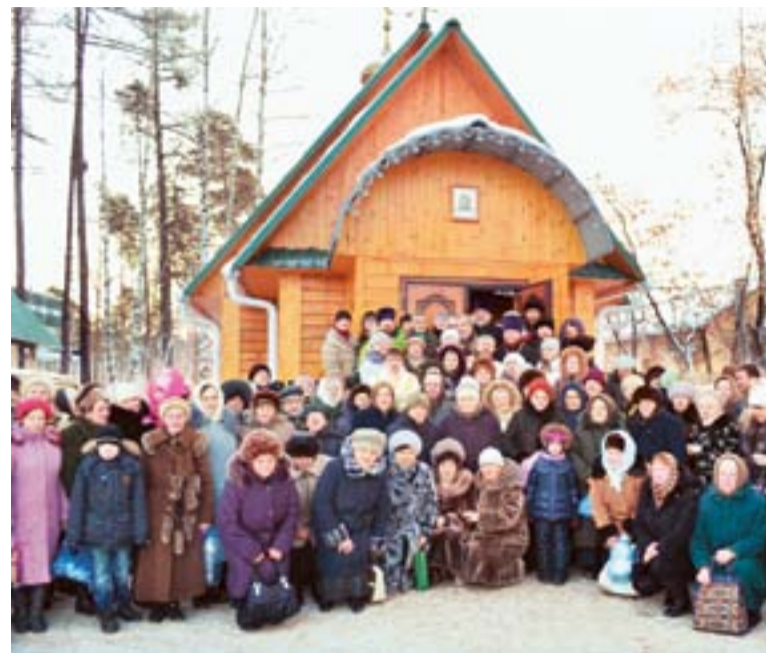
В день престольного праздника

Мне не раз приходилось наблюдать удивительные природные явления, совпадающие с началом богослужения: как по заказу, сквозь толщу облаков пробиваются солнечные лучи и освещают место, где вершится молитва; и каждый раз это восхищает. Вот и сейчас холодные зимние тучи стали спешно