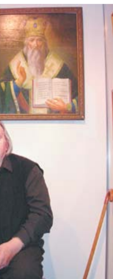
Художник в своей мастерской

не было. Тогда педагоги сказали: надо много, послали меня в Загорск (сейчас это Сергиев Посад), там было художественное училище с общежитием. В Загорске я и учился. Закончил в 1951 году, приехал домой, в Пермь, вступил в товарищество художников, которое позже было преобразовано в Художественный фонд, а затем, в 1973 г., вступил в Союз художников. Занимался оформительской работой: панно, монументальная живопись. А в 1969 году создал свой первый плакат – «Сохраняем памятники культуры». На этом плакате был изображен храм на голубом фоне. Надо сказать, что плакатом в Перми со времен войны никто не занимался, я был первым. С этим плакатом я принял участие в зональной выставке в Челябинске, его напечатал журнал «Художник». Это меня окрылило: я решил, что могу продолжать деятельность в этом направлении. Я занимался темой «культурного» плаката: например, когда хор Пермского музыкального училища поехал на гастроли во Францию, нужен был плакат, и обратился ко мне. Я сделал для них плакат «Плюющая Кама». Неоднократно выполнял зака-