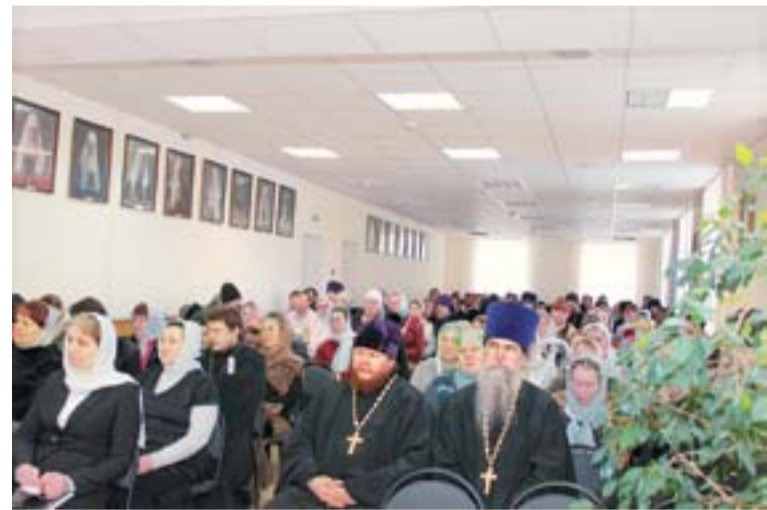
Идет заседание педагогического совета

В некоторых школах хорошо развита система дополнительного образования: в программу включены церковное пение, рукоделие, спорт. По