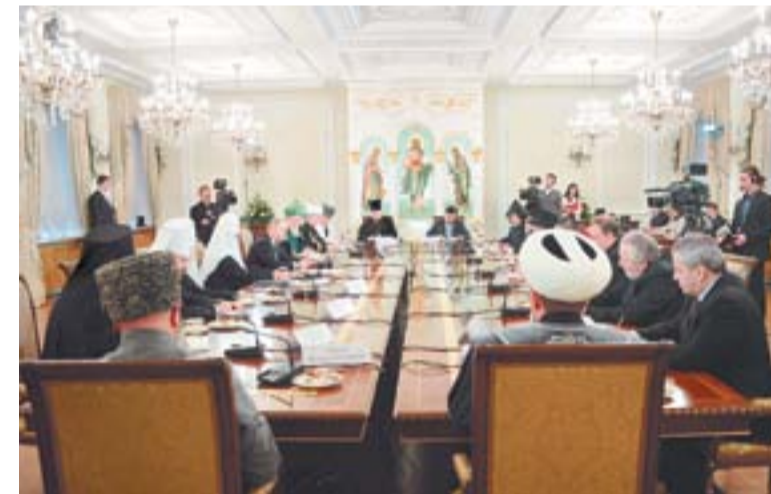
Встреча в Свято-Даниловом монастыре

А если этот идеал потребления будет массовым, и массовым будет идеал «отвращать» туда, где можно больше заработать? Мы потеряем Россию. Вот это самый важный стратегический вопрос. В 1990-е годы произошел трагический разрыв между образованием и воспитанием, между школой и воспитанием. Семьи