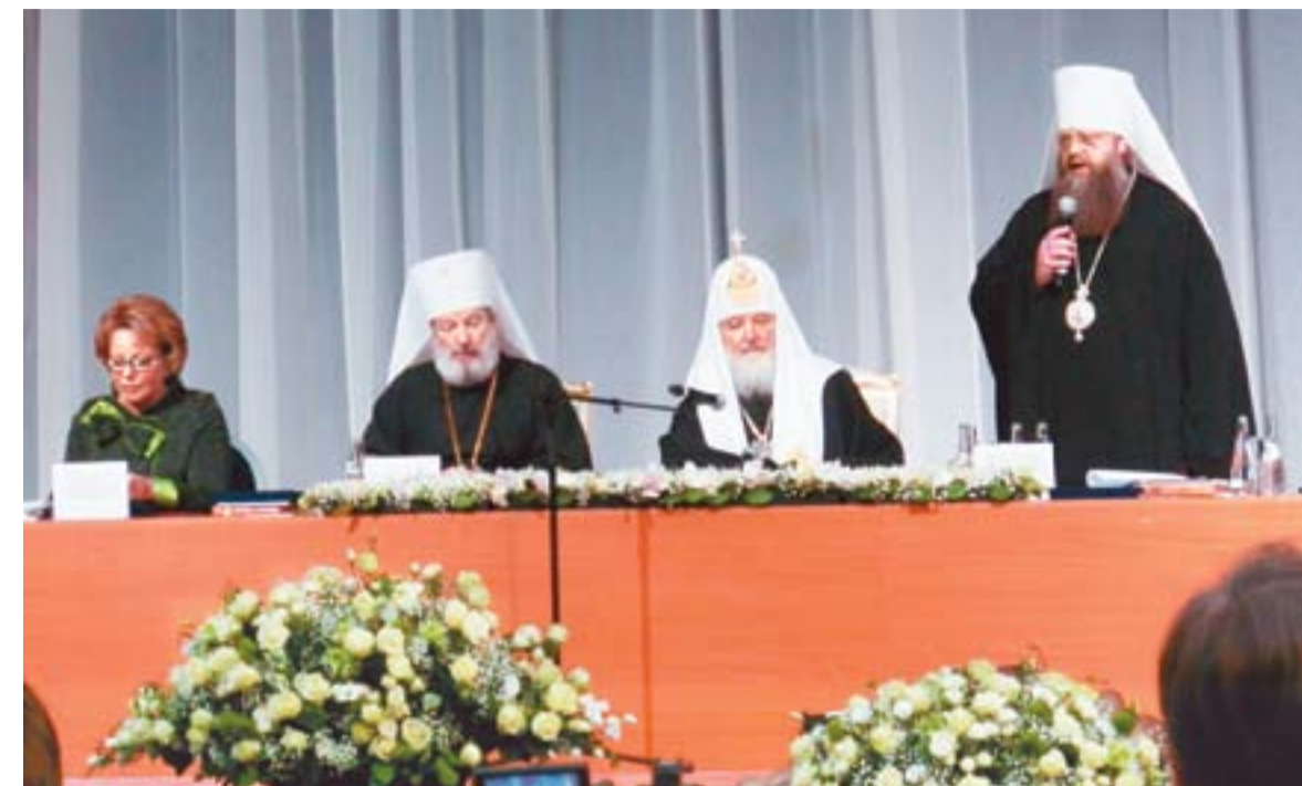
В президиуме Чтений: Святейший Патриарх Кирилл; митрополит Чешских земель и Словакии Христофор; митрополит Ростовский и Новочеркасский Меркурий; В. И. Матвиенко

«Это основа для укрепления гражданского мира и межнационального согласия, и здесь крайне важно расширять взаимодействие государственных, общественных и религиозных организаций. Мы не можем считать себя застрахованными от социальных потрясений, кризисов и революций до тех пор, пока не будет сформировано нравственное поколение людей, которые будут способны, руководствуясь не своими инстинктами, а убеждениями, отличать добро от зла и правду от лжи», — подчеркнул Свя-