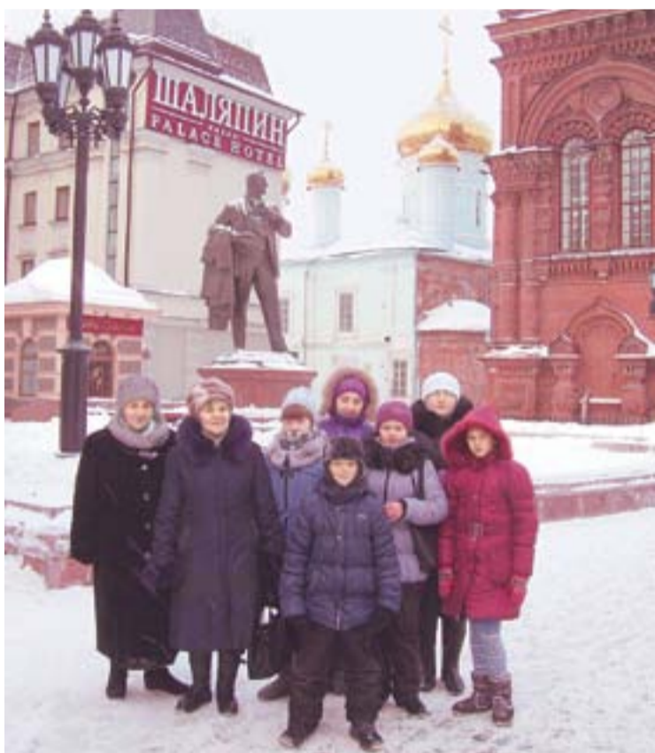
У памятника Федору Шаляпину