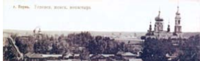
Пермский Успенский женский монастырь. Начало XX в.

В музее династии Каменских, созданном в Пермской гимназии № 4, представлена карта Перми, где отмечены