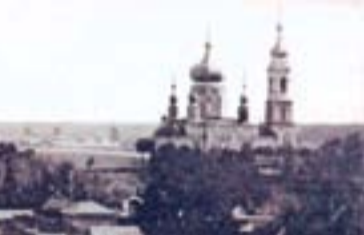
Усыпальница братьев Каменских

Но, конечно, самые масштабные пожертвования были произведены братьями в 1870 – 1880 гг. на устройство Успенского женского монастыря: тут и банковский вклад в 50 000 руб., и 10 000 руб. на содержание священника и псалом-