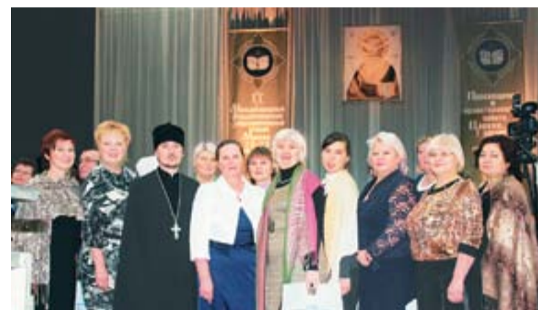
Представители делегации Пермской епархии

В заключение Его Святейшество пожелал, чтобы идеи, высказанные на чтениях, «не уходили в песок», что важнейшей целью наших молитв и трудов является воспитание молодежи — со смиренным умом, кротостью и терпением, как учил нас апостол Павел. Сейчас особо важно опереться на соборный разум, и таковым, без сомнения, являются по содержанию Рождественские чтения.