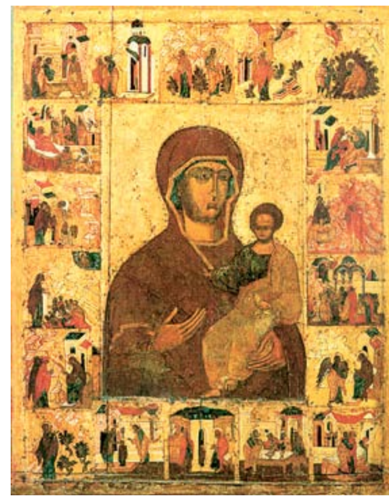
Икона Божией Матери «Одигитрия» Смоленская

Первую икону Божией Матери, как гласит Церковное Предание, написал святой апостол Лука. Богоматерь благословила его труд, произнеся при этом знаменательные слова: «С сим образом благодать Моя и сила да пребудут». С того момента через чудотворные иконы Богородицы на страждущее и погибающее в грехах человечество стал изливаться неиссякаемый поток Ее чудес и благодеяний. Святой Лука, «несомненно, обладал особым личным даром, который открыл ему неизреченную славу Богоматери. Он единственный из евангелистов оставил нам образ Пресвятой Богородицы и в слове...» Действительно, именно в Евангелии от Луки мы найдем повествование о событиях земной жизни Богоматери – вплоть до крестной смерти и погребения Ее Божественного Сына. Описание дальнейшей Ее жизни после Вознесения Господа сохранило для нас Церковное Предание. Любовь человечества к своей Небесной Матери, без сомнения, никогда не иссякнет, и огромное количество существующих икон Богоматери, древних и новых, – одно из ее проявлений. В настоящее время во всем мире существует более двадцати икон, связанных с именем святого апо-