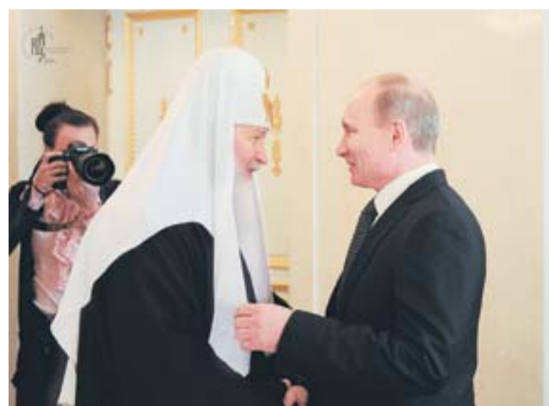
Патриарх Кирилл и В. В. Путин

Совершенно очевидно, что тот эрзац, который был когда-