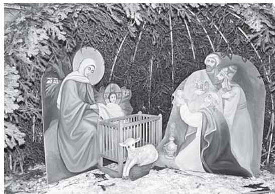
Рождественский вертеп, устроенный у Свято-Троицкого кафедрального собора

– Как же мы ответим Христу Спасителю, пришедшему в мир, чтобы спасти каждого из нас? Идем ли мы Ему навстречу? Желаем ли мы этого спасения? Не бежим ли мы от него? Или мы остаемся холодными наблюдателями всего того, что совершает Святая Церковь, и только потом обижаемся, что в жизни нашей происходит нечто такое, что мы не можем объяснить? Такие мысли должны посетить нас, братья и сестры, в эту праздничную ночь, дабы мы почувствовали свое отношение к Богу: каково оно, это отношение? Вот тогда мы определим и наше состояние в этом мире. Мы должны помнить: более двух тысяч лет назад Христос для того и пришел на землю, чтобы помочь нам сделать правильный выбор, сделать правильный шаг.