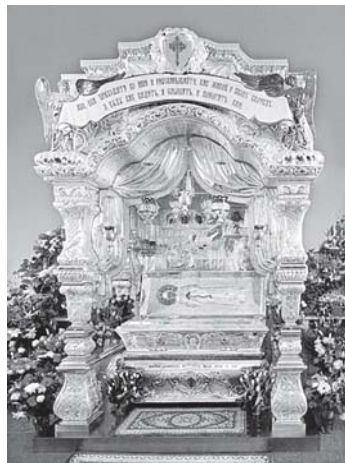
Рака с мощами св. Матроны Московской в Покровском женском монастыре (г. Москва)