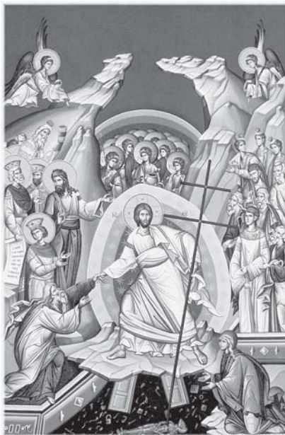
Сошествие во ад

Верующие встретили праздник Светлой Пасхи