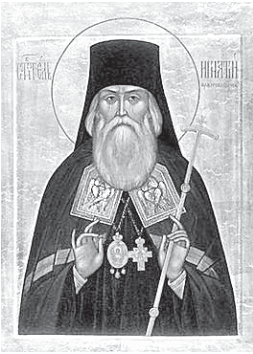
(Окончание. Начало в № 6–2011 г.)

● ГОД СО СВЯТИТЕЛЕМ ИГНАТИЕМ (БРЯНЧАНИНОВЫМ)