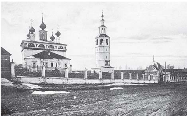
Спасская церковь г. Соликамска. Около 1900 г.