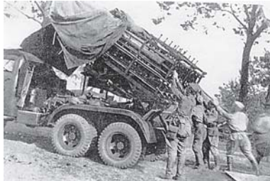
«Катюша» готовится к бою

Операция по освобождению Белоруссии была тщательно подготовлена. После мощных артиллерийских ударов и в сопровождении штурмовой авиации наши стрелковые части начали и развили столь стремительное наступление, что артилле-