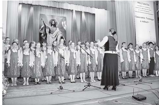
На сцене — юные артисты

Все коллективы, участвовавшие в третьем этапе фестиваля, также были отмечены грамотами, а их руководители