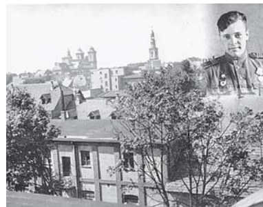
Победный май 45-го

Однако с момента окружения немецкой столицы войсками Конева войска 2-го Белорусского фронта рассекали Померанию «клиньями» на Кольберг, Штальзунд и Росток. В это время велись бои за форсирование пролива Дивенов для наступления на острова Узедом и Воллин. Наша бригада маршруту Эберсвальде — Пренцлау — Штеттин была снова переброшена по