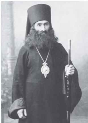
Епископ Тихвинский Андроник, викарий Новгородской епархии. 1908 г.

СВЯЩЕННОМУЧЕНИК Андроник, архиепископ Пермский и Соликамский (в миру Владимир Никольский), родился 1 августа 1870 г. После окончания семинарии юноша поступил в Московскую Духовную Академию, где, по благословению и совету святого праведного Иоанна Кронштадтского, принял в двадцать три года монашеский постриг с именем Андроник.