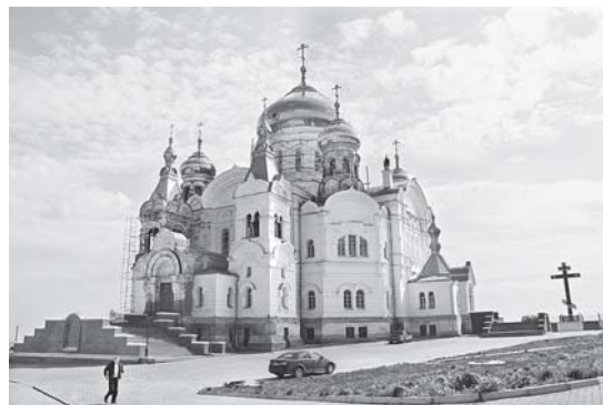
Наша «уральская жемчужина»

Все мы знаем, что уже много лет идет восстановление нашей великой святыни, нашего Уральского Афона. Большие усилия для этого прилагает Пермская епархия, общественные организации, благотворители, отдельные прихожане. Немалую помощь оказывает администрация края. Но все же предстоит проделать еще много работы, чтобы Крестовоздвиженский собор предстал перед нами во всем своем величии.