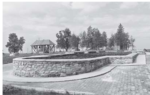
Восстановлен фундамент Иверского храма

Напомним, что возрождение Белогорского Свято-Николаевского миссионерского монастыря началась 20 лет