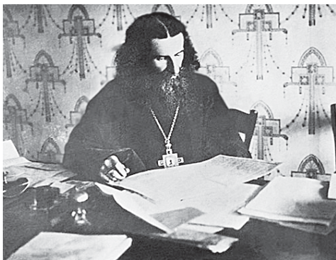
В Архиерейских покоях. Пермская кафедра