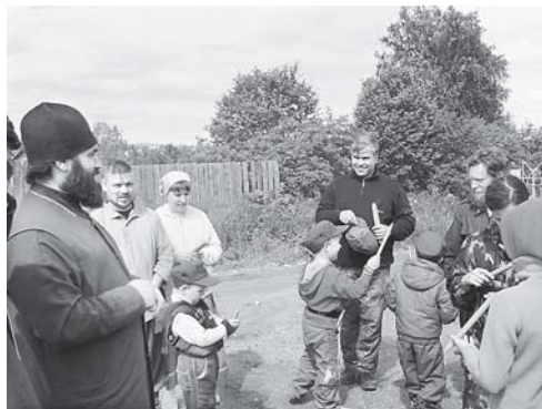
Надолго запомнится эта поездка!

Вечером дети играли в подвижные игры и смотрели художественные православные фильмы «Щенок» и «Питчи». Спали прямо в храме, расстелив по-походному туристические коврики и спальные.