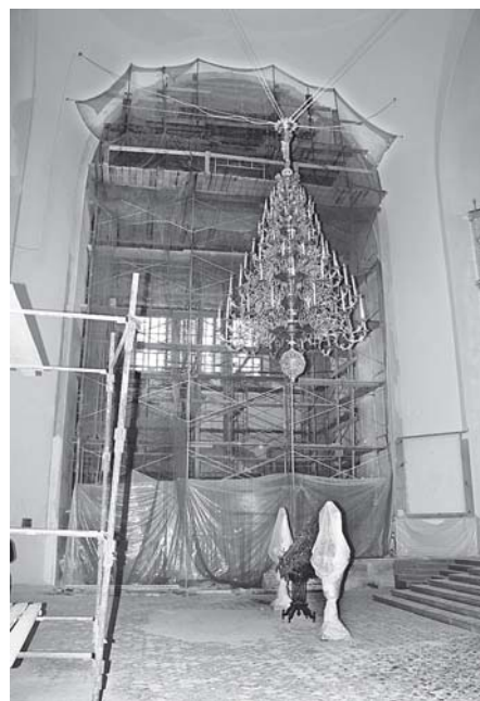
Ремонтные работы близятся к завершению

предстояло осилить тысячи квадратных метров штукатурных работ — очень сложных, затратных и трудоёмких. За короткий период выполнена штукатурка сводов и стен левого придела Крестовоздвиженского собора, а также хоров главного и боковых приделов. Теперь штукатурные работы внутри храма близки к завершению.