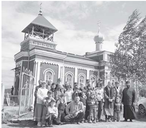
Участники паломнической поездки у храма Сретения Господня

Ранним утром 18 июня от городского пляжа Камской ГЭС отчалили и взяли курс на север два ялика*, полные детей и взрослых, — это началось первое паломничество по камским водам для семей учащихся Музея-школы имени Императрицы Александры Феодоровны (при Свято-Троицком Стефановом мужском монастыре). Предстояло пройти на веслах и парусах, вверх по течению, Камское водохранилище и русла рек Чусовой и Сылвы для достижения конечного пункта — поселка Старые Ляды. Цель этого двухдневного водного паломничества — участие в Божественной литургии на празднике Всех святых в храме Сретения Господня.