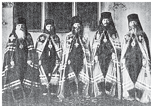
Дореволюционное фото. В центре – архиепископ Андроник; крайний слева – епископ Феофан (Ильменский). 1917 г.

В 2000 году архиепископ Андроник был причислен к лику святых. Незадолго перед арестом архиепископа один священник обратился к нему с просьбой о врагумлении: «Как спасти паству от губящих ее