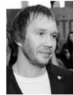
Евгений Миронов, народный артист России:

Родная сестра моей бабушки была игуменней, а вторая сестра ее — монахиней. По линии отца был церковный староста. Мой отец (Царство ему Небесное!) был верующим человеком, и ни в какие