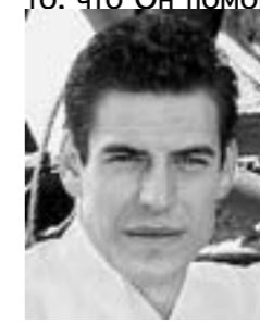
Николай Бурляев, президент международного кинофорума «Золотой Витязь», народный артист России: