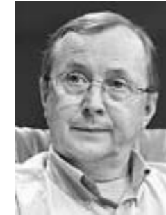
Дмитрий Дюжев, актер, телеведущий:

меня. Он говорил так, как если бы был грешнее меня в тысячу раз, как если бы он в тысячу раз более меня сомневался. Я был просто потрясен всем происходящим: впервые я общался со священником, который — это было видно — переживает за весь мир, и за весь мир молится. Встреча была недолгой — всего полчаса. Но в эти полчаса я чувствовал что-то необыкновенное. По форме это, конечно, не было исповедью, но важности и глубине этот разговор стал для меня чем-то очень значимым.