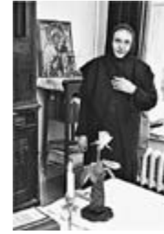
Ольга Гобзева, актриса (теперь монахиня):

Сказать, что у меня случилась какая-то трагедия или неудачно сложилась судьба, — было бы неправдой. Я действительно много снималась, у меня около тысячи фильмов, хотя не все фильмы были знаменитыми, моя творческая судьба сложилась очень удачно. Я всегда делала то, что хотела. Причина моего ухода кроется очень глубоко, возможно, в моем роду.