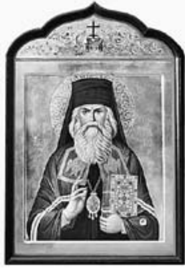
(Продолжение. Начало в № 11–2011 г.)

• ГОД СО СВЯТИТЕЛЕМ ИГНАТИЕМ (БРЯНЧАНИНОВЫМ)