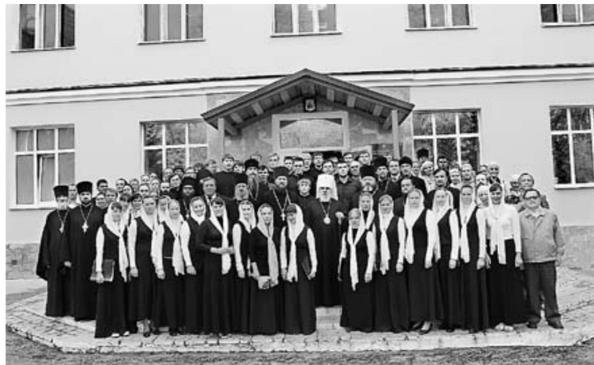
À táiyóúé ááú (1 náibúády 2011 á.)

училище размещалось на территории Свято-Троицкого кафедрального собора Перми, в бывшем здании воскресной школы. Обучение длилось четыре года. В 2007 г. совместно с Пермским медицинским колледжем было создано отделение сестер милосердия, выпускники которого получают диплом государственного образца, позволяющий работать в медицинских учреждениях, и одновременно диплом церковного образца, подтверждающий православное образование. В 2008 г. была учреждена кафедра теологии в Пермском государственном университете. В декабре 2009 г. на заседании Священного Синода Русской Православной Церкви принято решение о