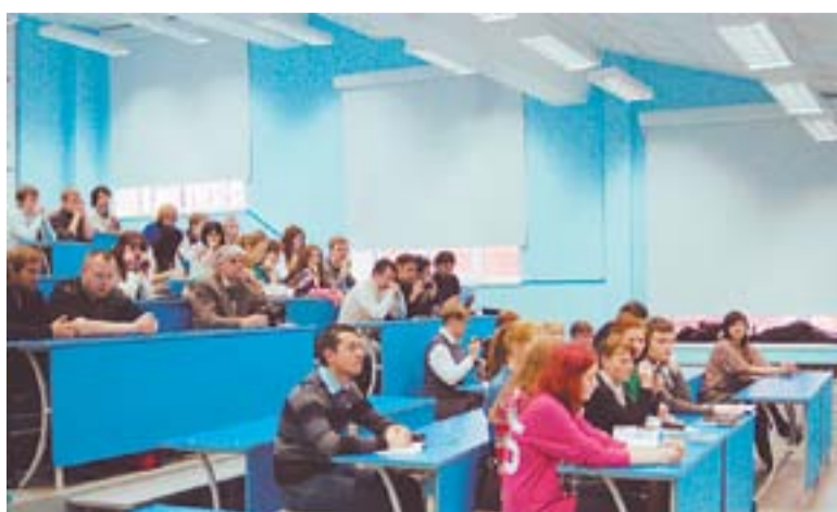
На заседании одной из секций