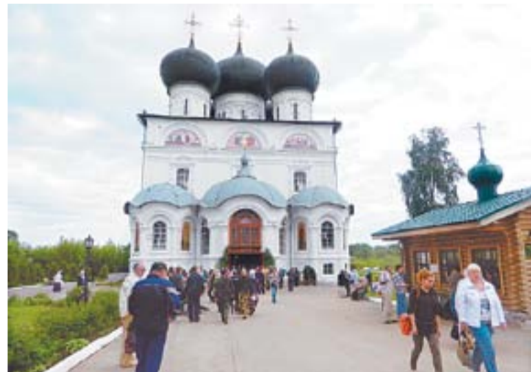
Успенский собор Трифонов монастыря (г. Киров)