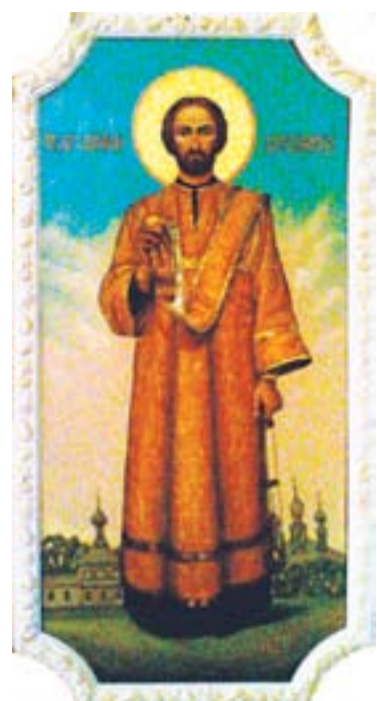
ломщиком к тому же кафедральному собору 1894 г. 17 января.

Состоял учителем церковно-приходской школы в г. Перми на Заимке 1893—1895 гг. Определен старшим пса-