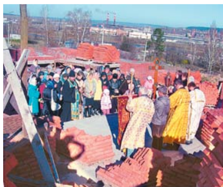
На месте строящегося храма началось богослужение

После богослужения, которое закончилось около 11 часов, с крестом и хоругвями впереди, прихожане вышли на улицу. С традиционным песнопением.