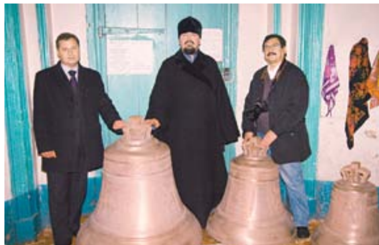
Вечером 18 октября в Казанский храм г. Осы прибыли новые колокола.