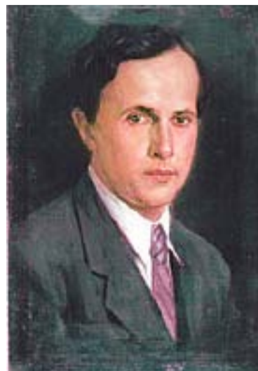
М. М. Потапов (портрет), 1948 г.

В день открытия выставки здесь прошли 4-е Потаповские чтения-2012. Они проходят в рамках проекта – победителя краевого конкурса общественных и гражданских инициатив. Событие состоялось благодаря соединенным усилиям фонда «Преображение», квартиры-музея М.М. Потапова, НП «Дом мастера», музеев Соликамска, Чердыни, Ильинского при поддержке администрации Пермского края и города Соликамска. По мысли организаторов, презентация должна была состоять из двух частей, которые планировалось посвятить собственноручно выполненным иконописцем работам в Соликамске. На деле получилось органичное, волнующее действо, сопровождавшееся музыкальными вставками; под древними сводами собора особенно проникновенно звучали