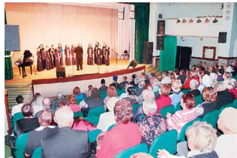
Залы были переполнены