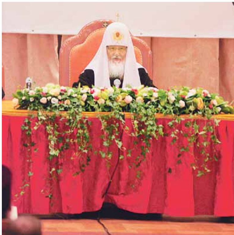
Святейший Патриарх Кирилл отвечает на вопросы делегатов форума

Конечно, это тяжелая ноша, особенно в условиях жесткого прессинга со стороны так называемых либеральных СМИ. Как вести себя православным журналистам в условиях навязанной информационной войны? Этой теме была посвящена панельная (с участием экспертов) дискуссия: «Положительная повестка дня: как мы ее создаем». Выступая в ходе обсуждения, председатель Синадального информационного отдела, профессор