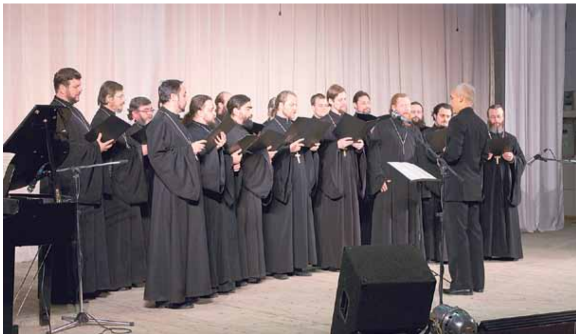
На сцене – хор священников