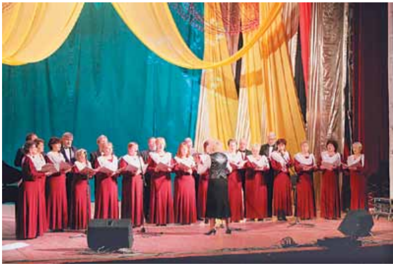
Звучат духовные песнопения

В целом благотворительные концерты получили широкий общественный резонанс в Пермском крае; в Центр религиозного образования и катехизации при ПДС поступило множество заявок на их проведение в других городах. Это