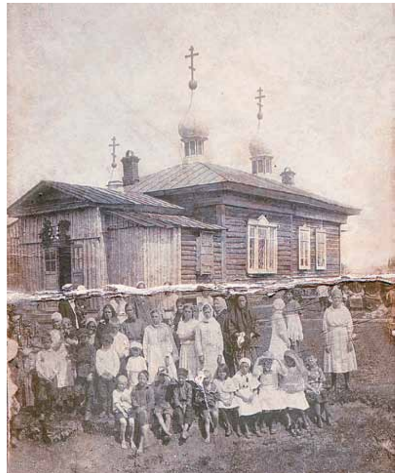
Крестовоздвиженская церковь-часовня в пос. Вышка-2 и ее прихожане (20-е годы)