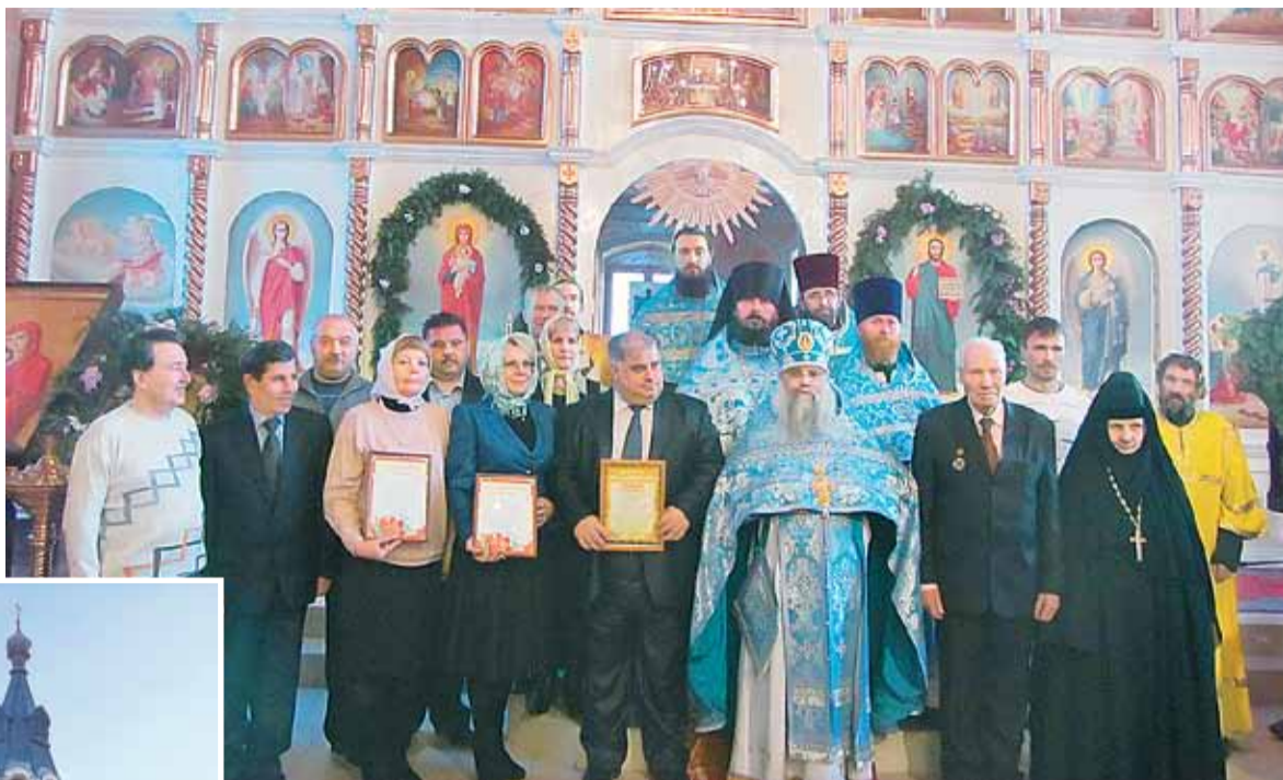
В день юбилея в храме Вознесения Господня

Активные прихожанки получили в подарок чайные наборы