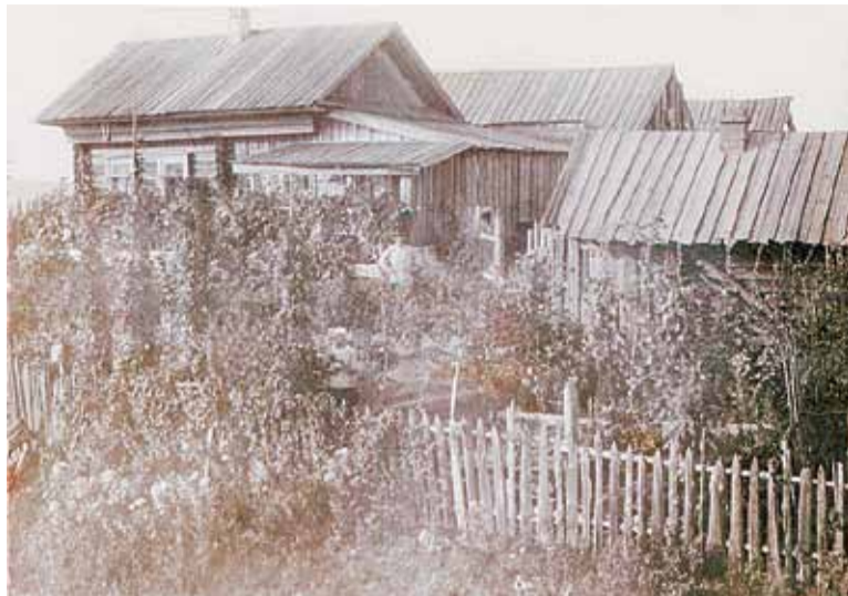
Дом, в котором проживал о. Леонид Пономарев (ныне разрушен)

15 октября 1917 г. Преосвященный Феофан, епископ Соликамский, рукополагает диакона Леонида в сан иерея. За десять дней до Октябрьского переворота, за десять дней до революции, последствия которой кровью будут вписаны в