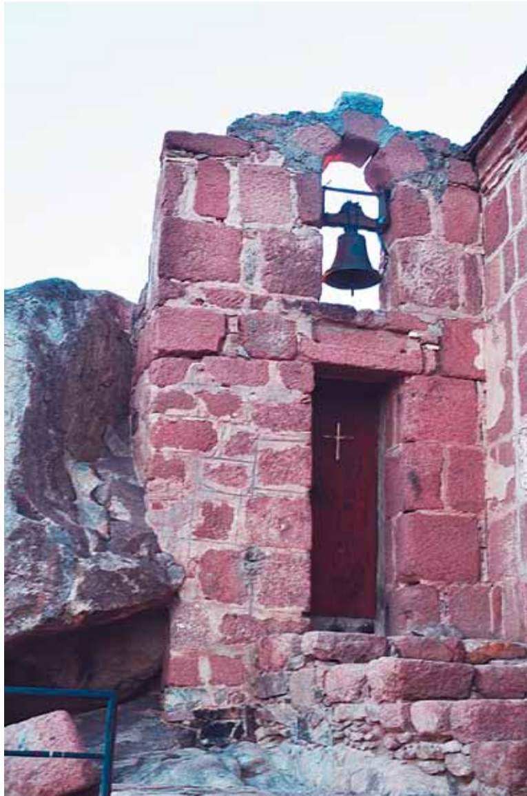
Свято-Троицкая часовня на вершине горы Синай

И вот мы в гостинице. Номера маленькие и очень простые, но уютные; кондиционеры стараются вовсю, разогревая прохладный ночной воздух. Все-таки декабрь, египтяне мерзнут, надевают куртки. Теперь можно поужинать и отдохнуть перед дорогой. В трапезной нас накормили курицей – оказалось, что на Ближнем Востоке это блюдо считается вполне постным (мы ропщем, но едим). Никаких напитков, даже воды, не предложи-