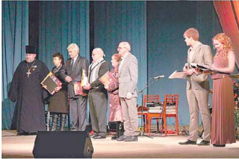
Во время церемонии награждения

Вечером в культурно-деловом центре ОАО «Азот» состоялся благотворительный концерт, организованный попечительским фондом «Никольский». Открыл праздничный вечер