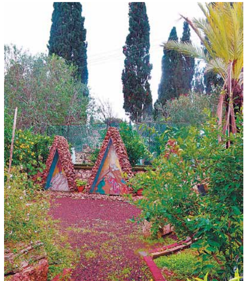
Гора Фавор. Место Преображения Господня