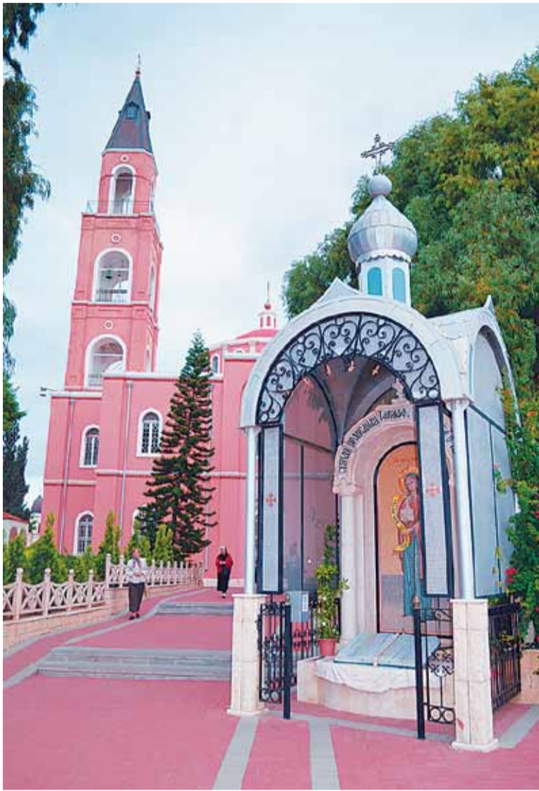
Храм святого апостола Петра и праведной Тавифы в Яффо