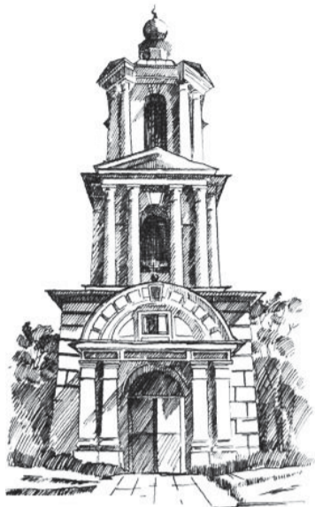
Так было... Так стало