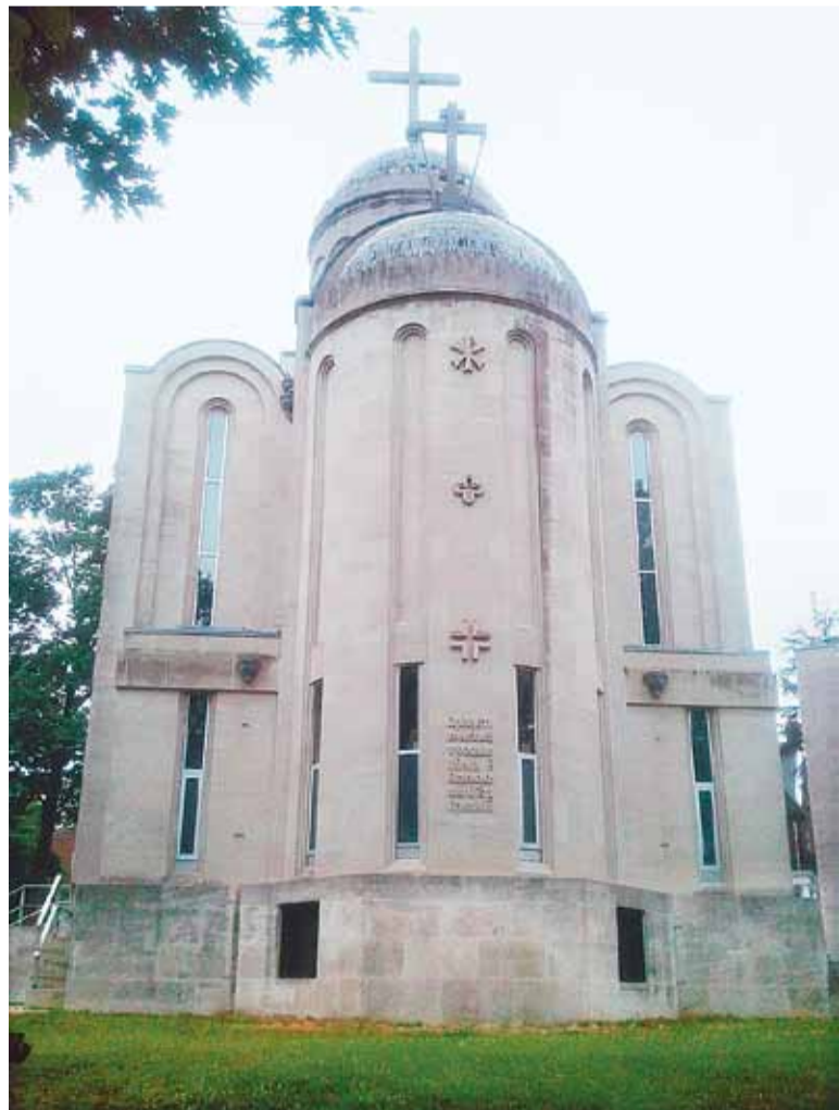
Собор св. Николая (восточная сторона)