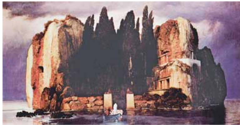
Беклин. «Остров мертвых»

этой полоске земли. Все больше документов появляется о том, что чекисты использовали остров возле керосиновых складов Нобеля как место казни. Когда-то это было любимое место для отдыха пермяков, но вдруг закончилась идиллия. С 1918 г. над островом зазвучала другая музыка, далеко не пасторальная. Образованным обитателям благословенной Перми вспоминался сюжет популярной в начале XX в. картины Беклина «Остров мертвых». На ту же тему написал поэму Сергей Рахманинов, чутко уловивший приближение грозы и передавший через музыку предчувствие кары, ожи-