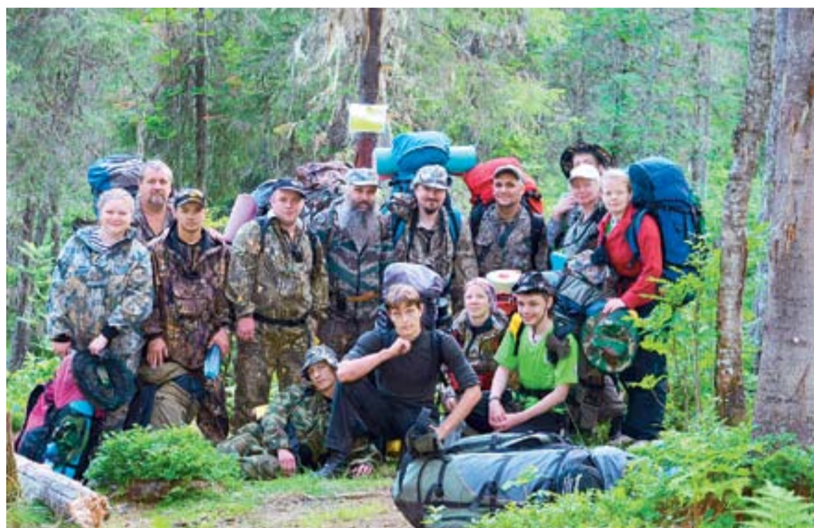
Участники миссионерского сплава