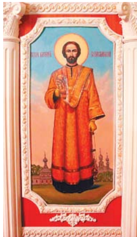
Икона сщмч. Василия Воскресенского

В этой статье приведен лишь краткий обзор материала, содержащего факты из биографий некоторых новомучеников и исповедников, проживавших на территории Верхнекамья. Однако имена многих невинно пострадавших за веру христиан нам еще неизвестны. Продолжая поиск в архивных документах, мы надеемся обнаружить новые свидетельства высокой жертвенности за веру православную, проявленную жителями верхнекамской земли.