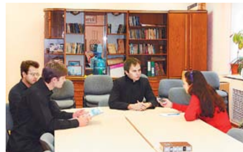
Идет беседа с семинаристами