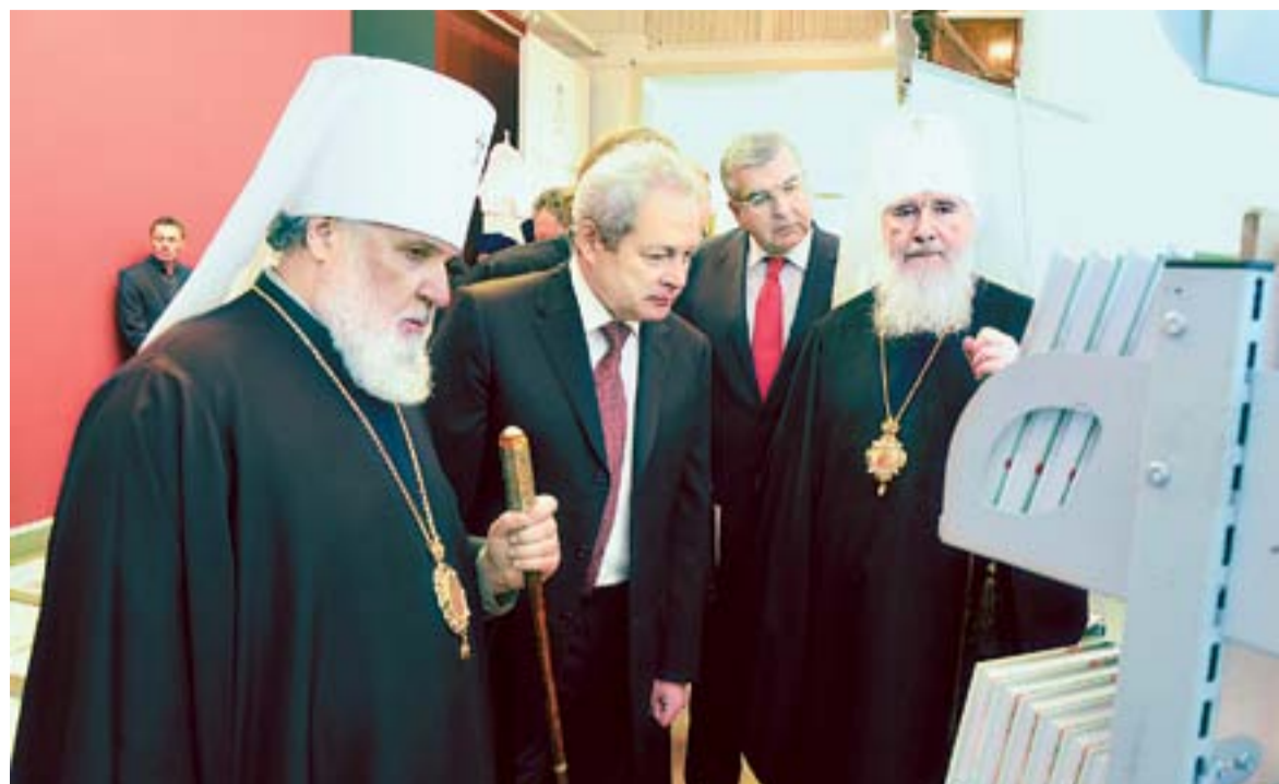
Высокие гости у одной из экспозиций выставки

Сколько примеров для себя мы можем найти сегодня в Евангелии, которое показывает, как должно и как не нужно