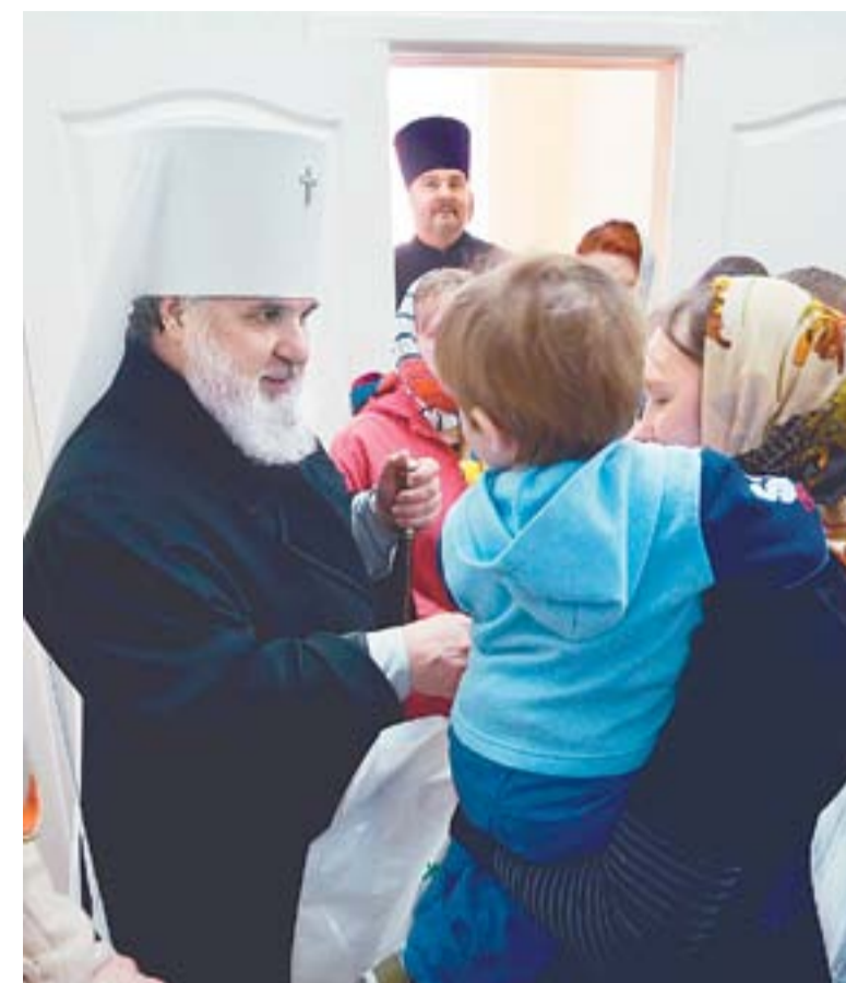
Митрополит Мефодий во время посещения центра «Колыбель»

очередь. Наш специалист очень серьезно относится к своей работе, прием каждого пациента в среднем длится полчаса-два часа. Люди идут охотно: иногда все, что нужно для достижения покоя и уверенности в себе, — это поговорить по душам с вежливым, понимающим человеком.