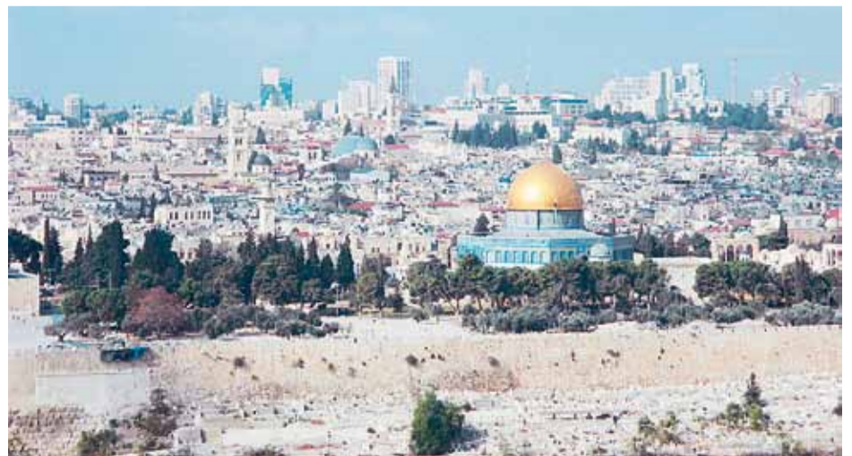
Вид на Старый Иерусалим с Елеонской горы