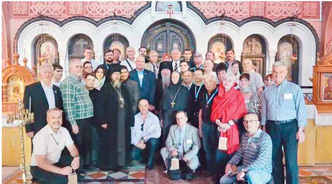
В храме Марии Магдалины. Гефсимания