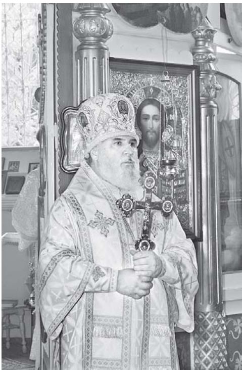
К своей пастве обращается митрополит Мефодий

Визит митрополита Пермского и Соликамского Мефодия в Пророко-Ильинский храм в престольный праздник