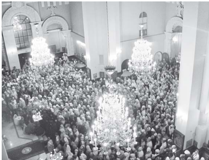
Многолюдное богослужение в Храме-на-Крови

...Громкие, стремительные удары колокола пронзают всю округу, темно-синее небо, ноч-