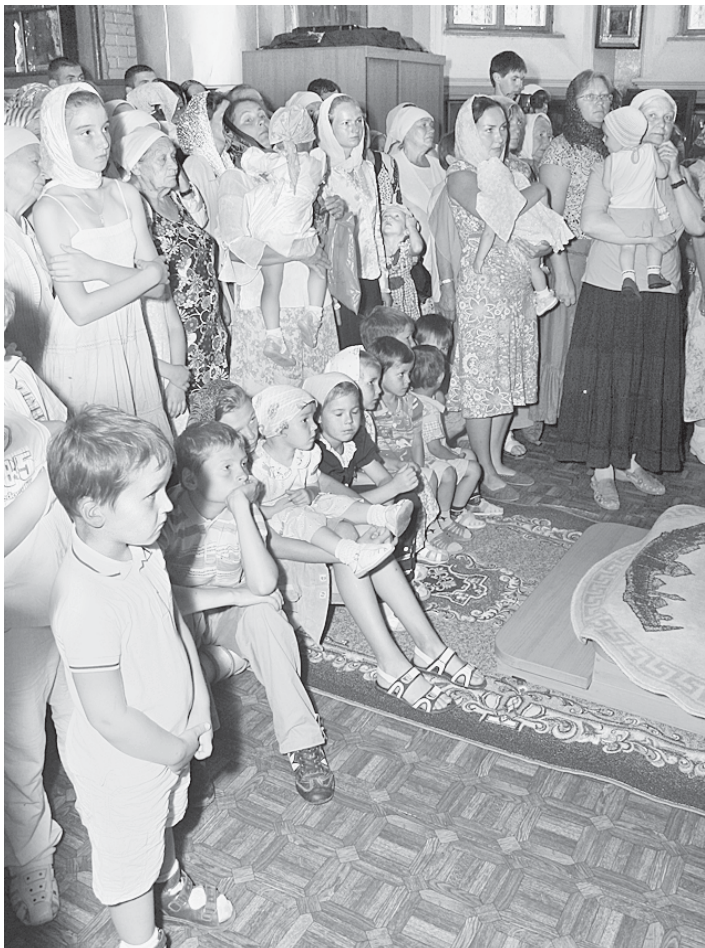
«Будем же добры и кротки сердцем...»