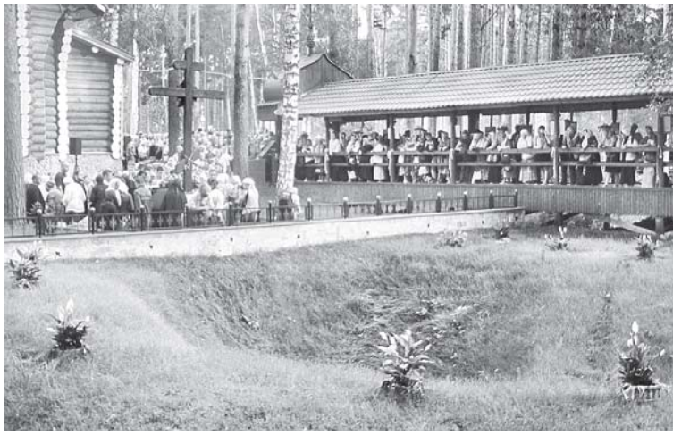
Молебен на Ганиной Яме

Из святого места уезжать совсем не хочется, но нас ждет