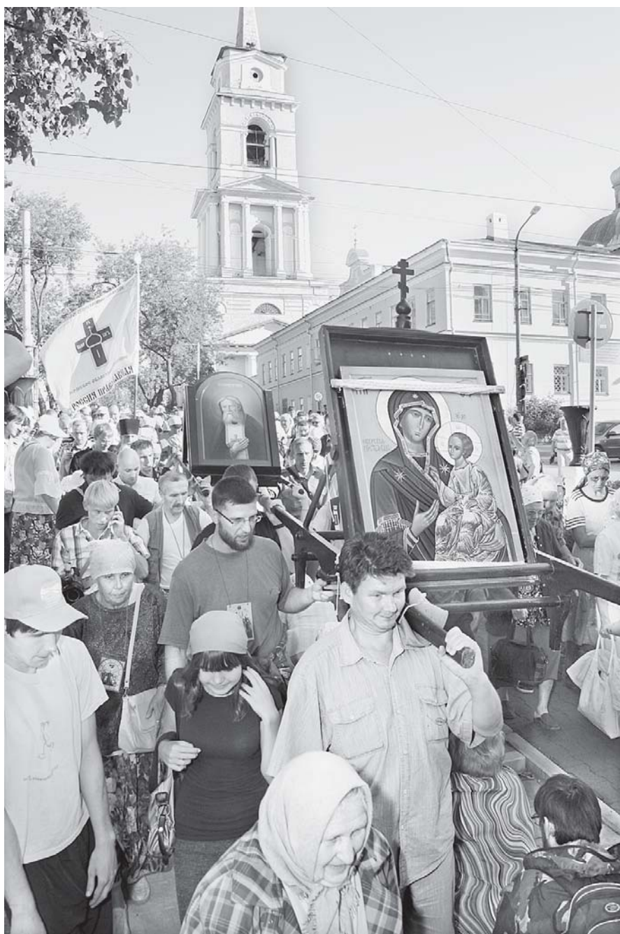
С верой и молитвой

26 июля от Свято-Митрофаниевского храма Перми сотни паломников отправились в традиционный Свято-Серафимовский крестный ход