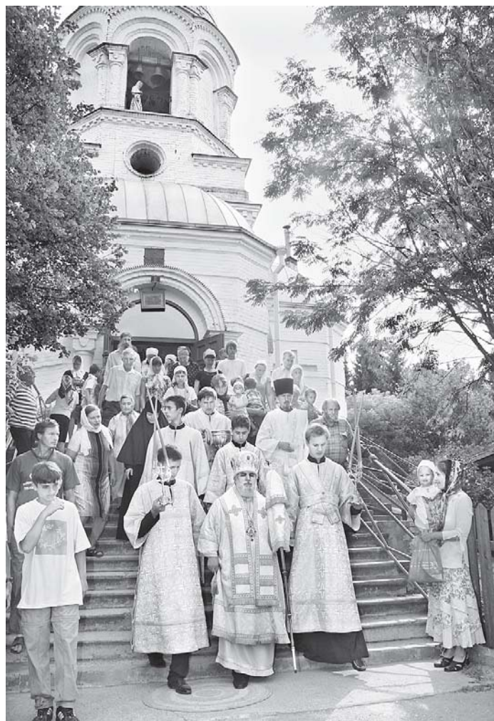
Традиционный крестный ход в престольный праздник