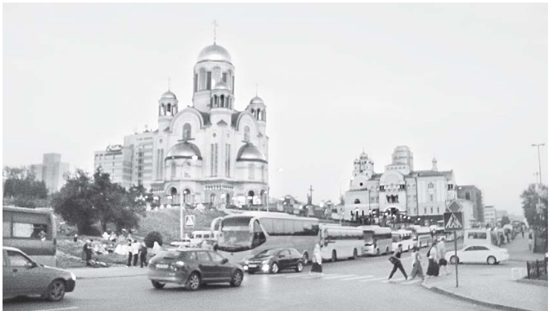
Столица Урала. Раннее утро 17 июля

Нашей группе не приходится стоять в огромной толпе, ведь для общины глухо-