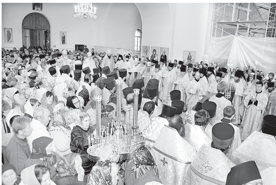
Сегодня положено начало большому епархиальному празднику