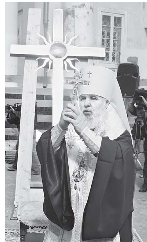
«Спаси, Господи, люди Твоя...»

Еще не убраны леса – идут работы по ремонту каркаса шпиль, заменяется его обрешетка и устанавливается новое покрытие. Высота креста – около трёх метров, он