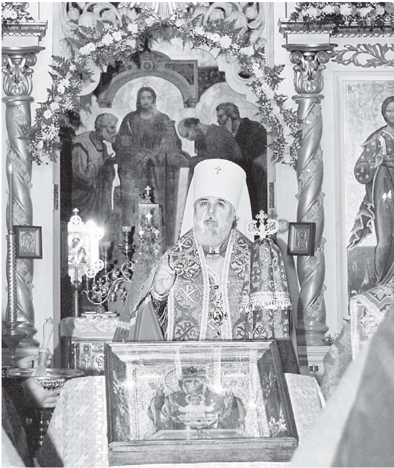
Архиерейское слово, посвященное святыне

В Пермь прибыла чудотворная икона Божией Матери «Неупиваемая Чаша» из Серпухова