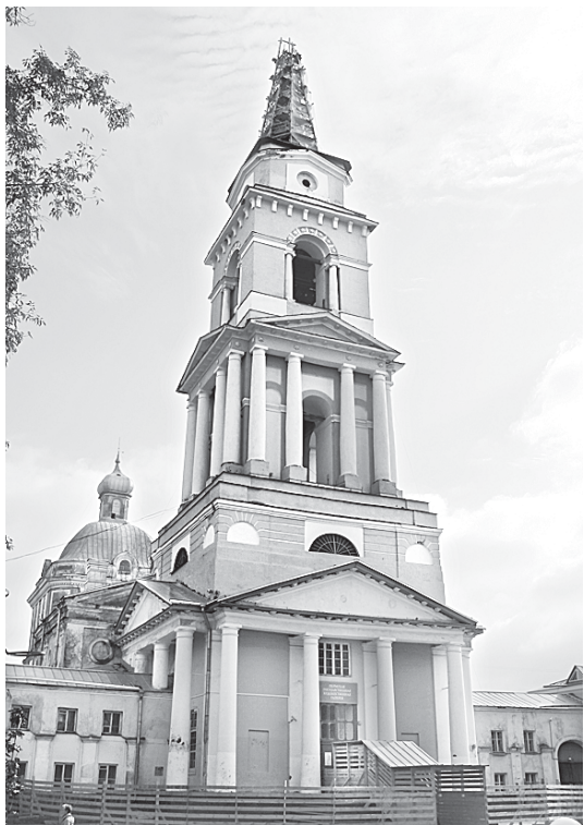
Для нас это дом Божий

Спасо-Преображенский кафедральный собор приобретает свой исторический облик